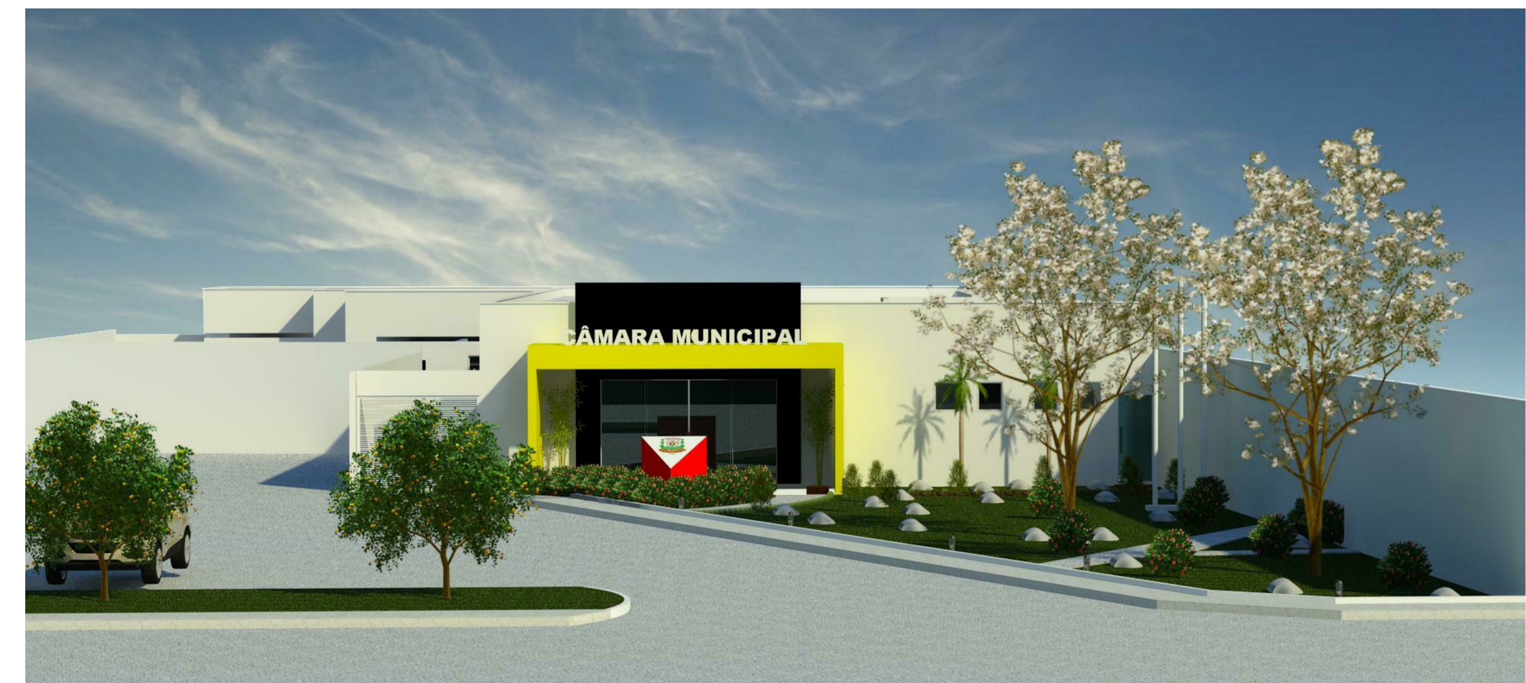
3 Imagem em 3D SEM ESCALA