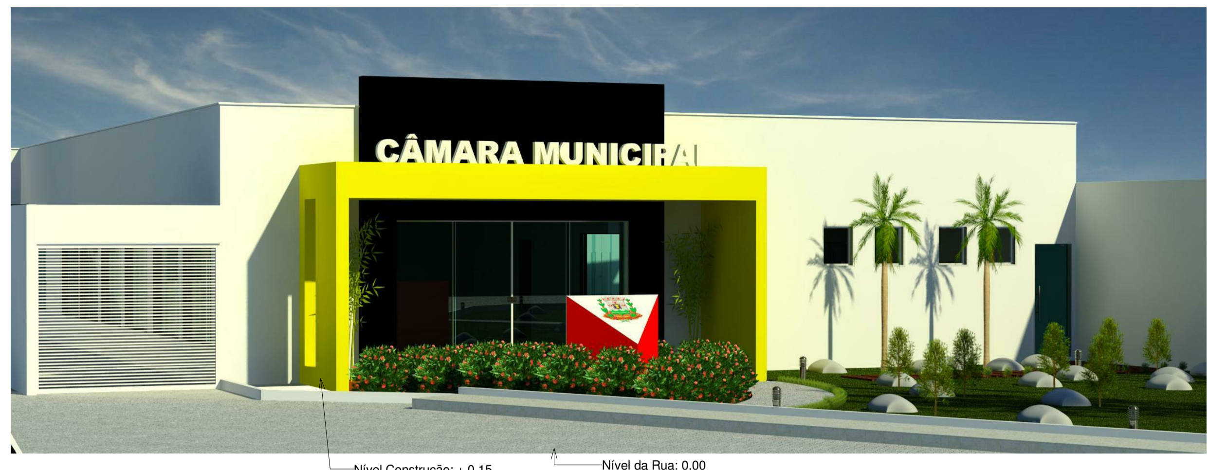
2 Fachada 3D SEM ESCALA